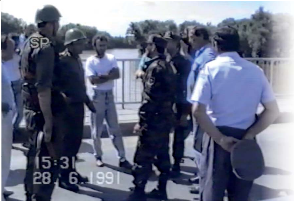
Pogajanja na mostu

Hrvaška milica je slovensko TO obvestila, da je 29. junija JLA poskušala priti v Prekmurje tudi pri vasi Križovec s postavitvijo pontonskega mostu, vendar ji zaradi razmočenega terena in visoke, deroče Mure ni uspelo.