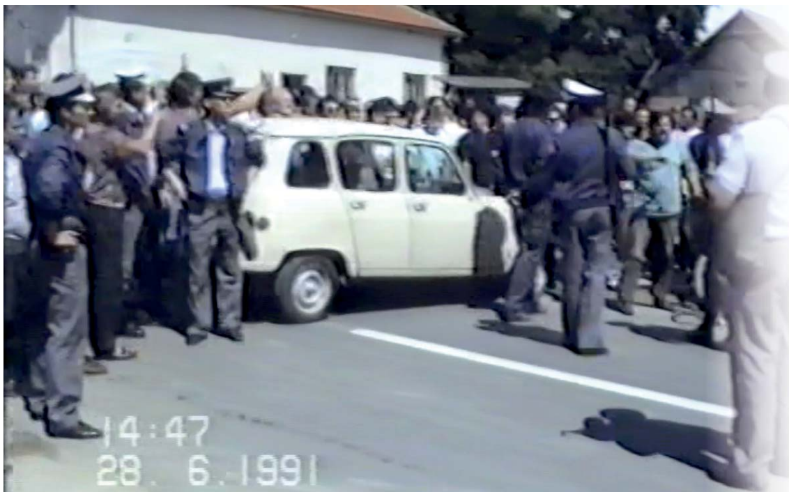
V Murskem Središču so prebivalci postavili živi ščit.