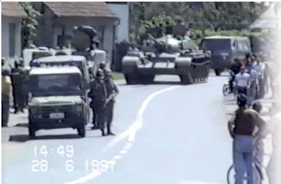
Prihod bojne skupine JLA v Mursko Središče