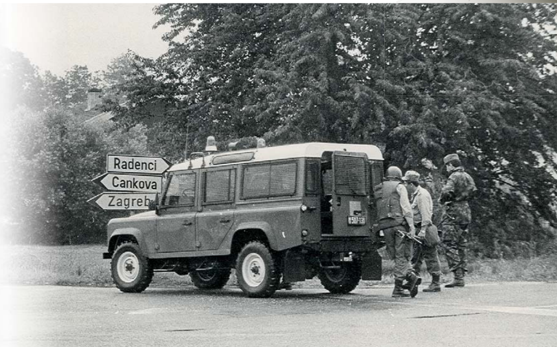
Pomenljiv posnetek smerokaza in braniteljev pred JLA v Gederovcih