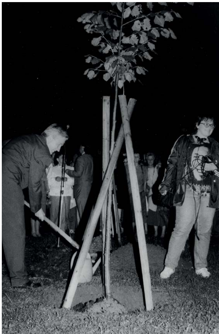
Slovesnost ob sprejetju odločitve o neodvisnosti in samostojnosti 26. junija 1991 v parku v Murski Soboti

Tudi v soboški občini smo pripravili slovesnost ob sprejetju odločitve o neodvisnosti in samostojnosti. Tako kot slovesnosti v Ljubljani se je tudi te kljub dežju udeležilo veliko prebivalcev naše občine. V predsedstvu občine smo skupno s predstavniki vseh političnih strank pripravili zapis o občini, ki je zajel sestavo občinske skupščine in njenih organov z datumom 26. junij 1991, z imeni njenih predstavnikov, velikost in število prebivalcev. Zapis smo vložili v steklenico in jo zapečatili. Po zborovanju smo v spomin na ta dogodek posadili lipo kot simbol slovenstva, pod njene korenine pa položili navedeno steklenico. Tako bodo morda naši zanamci čez mnoga leta našli ta zgodovinski zapis o dogodkih, ko je nastajala samostojna Slovenija.