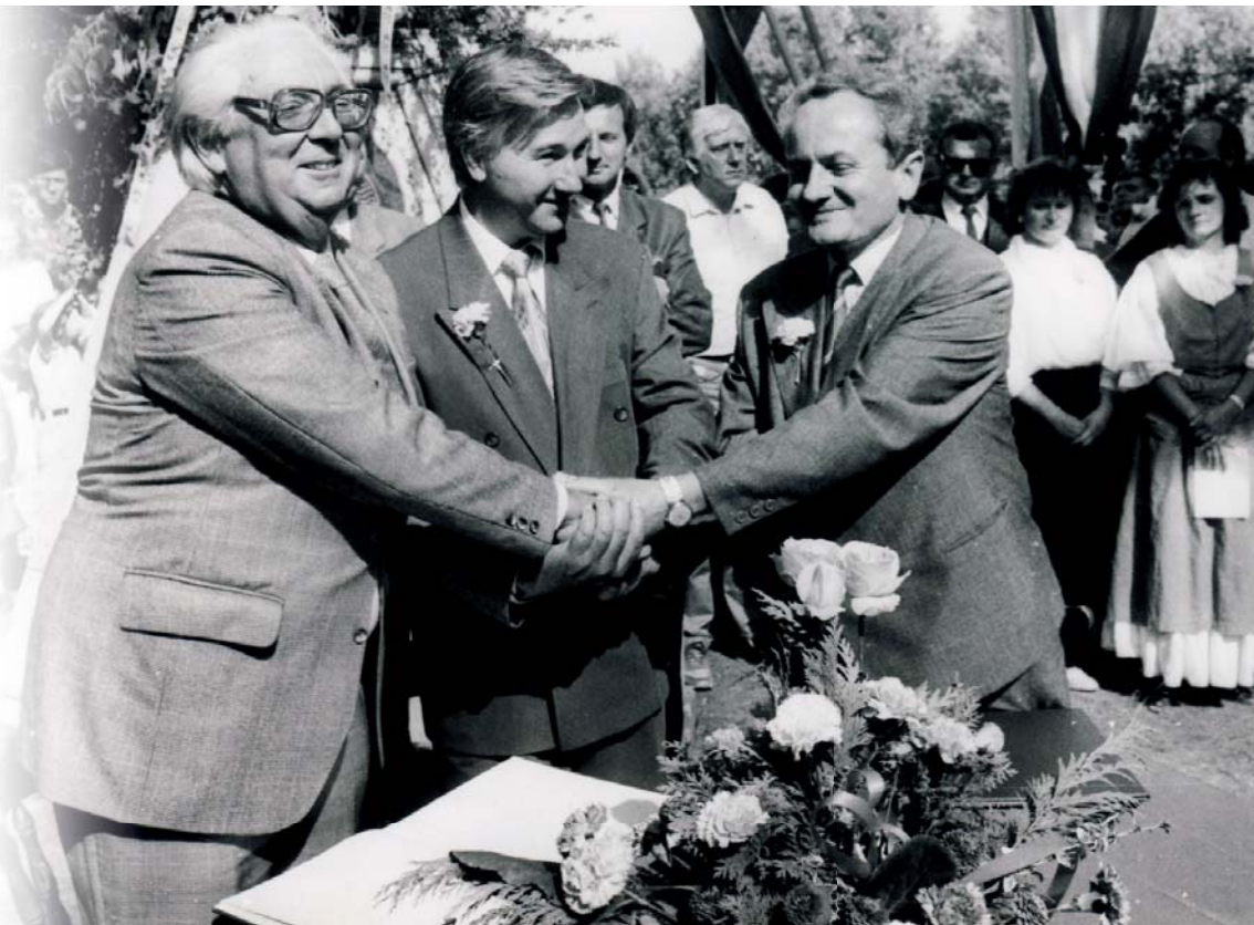
Srečanje prebivalcev obmejnih občin Murske Sobote, Körmenda in Feldbacha na tromeji 27. maja 1990

Politično delovanje za uveljavitev samostojnosti se je v občini začelo že pred 26. junijem 1991. Prvi tak dogodek je bilo srečanje prebivalcev obmejnih občin Murska Sobota, Körmend in Feldbach na tromeji 27. maja 1990. Organizatorji tega srečanja so bili župani teh treh občin. Srečanja so se poleg mnogih prebivalcev ob meji udeležili tudi dr. Rupel, zunanji minister Madžarske dr. Jeszenszky in državna sekretarka z avstrijskega zunanjega ministrstva. Prebivalci treh dežel so prišli na tromejo brez potnih listin, kar je bilo za nekatere, predvsem z Madžarske, velik dogodek. Prireditev je bila deležna velike medijske pozornosti, kot o zanimivosti pa je o tem poročala celo televizija iz Švice. Ob tej priložnosti smo odkrili obeležje z napisi v treh jezikih, ki še danes spominja na ta dogodek, v svet pa poslali sporočilo, da v tem delu Evrope želimo živeti v miru in sodelovanju.