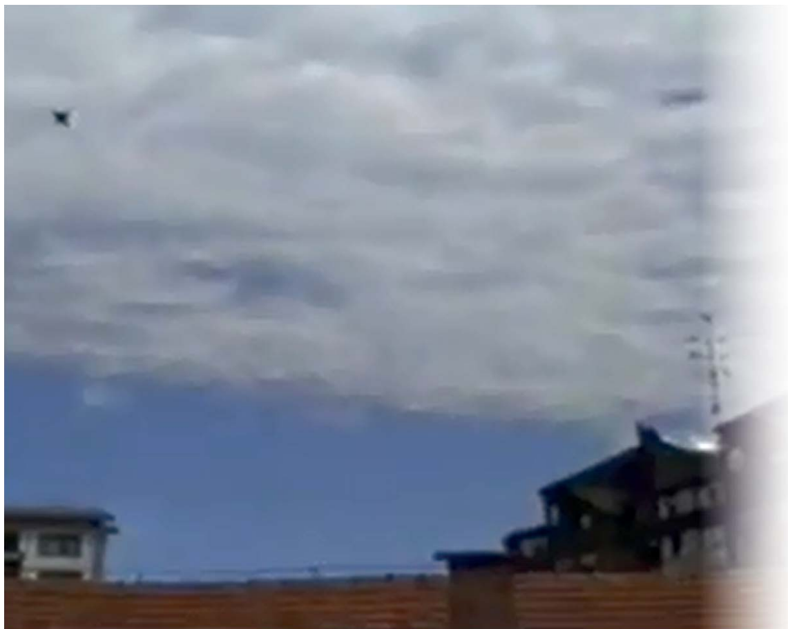
Letalski napad na Mursko Soboto 28. junija 1991

TO je vojašnico obkolila hitro, o čemer govorimo v poročilu upravnega organa. Obkolitev je naletela na velik odmev med prebivalstvom, še posebej, ker je prihajalo do preleta letal in helikopterja ter raketiranja okolice vojašnice. Na srečo nihče od naših pripadnikov ni bil poškodovan, poškodovanih je bilo le nekaj streh na hišah v bližini vojašnice. Med raketiranjem sta bila hudo ranjena vojaka JLA, od katerih je eden pozneje v bolnišnici umrl. Ranjene vojake sem v bolnici obiskal 29. junija.